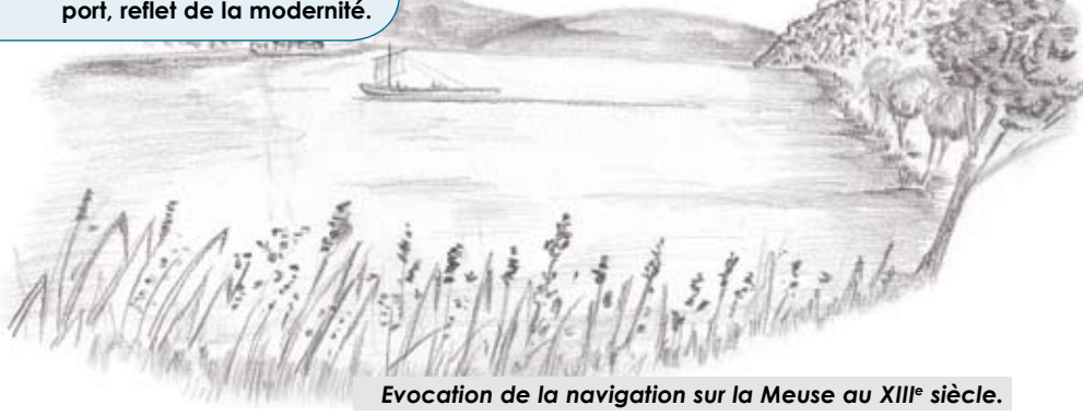
Evocation de la navigation sur la Meuse au XIII e siècle.

Au Moyen Âge, la Meuse est le moyen de transport le plus sûr, comparé aux chemins des forêts d'Ardenne, grouillants de brigands. Les richesses des villes mosanes s'exportaient vers le monde entier et transitaient via des bateaux à fond plat, présentant un faible tirant d'eau. Leur profil permettait l'échouage et pouvait se passer de quais et d'embarcadaires. Se laissant porter par le courant, ils pouvaient parcourir plus de 100 km par jour ! Leurs voyages les menaient vers les bords de la mer du Nord, proches des villes hanséatiques.